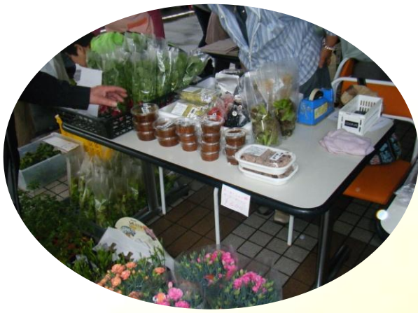
花鉢や特産品の出品もあります。