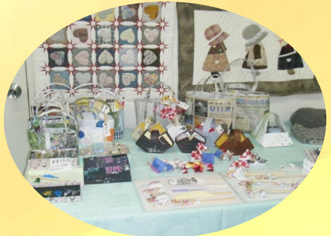
手作り作品の展示