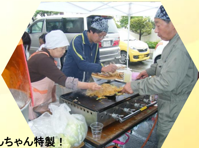
おんちゃん特製！ ノーミート焼きそば