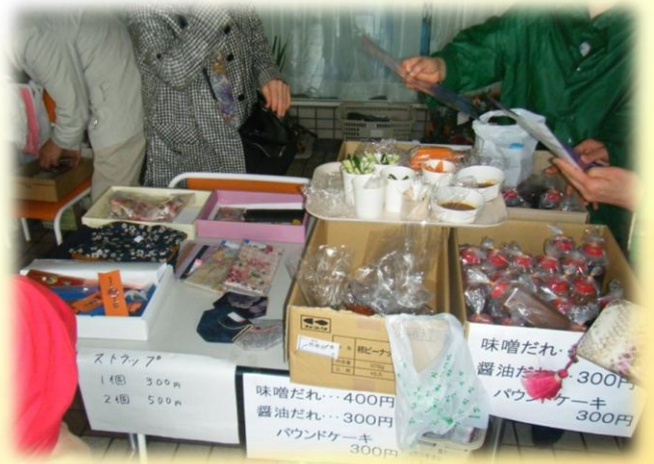
大好評の万能タレ、手作り味噌。今年も出品いたします。