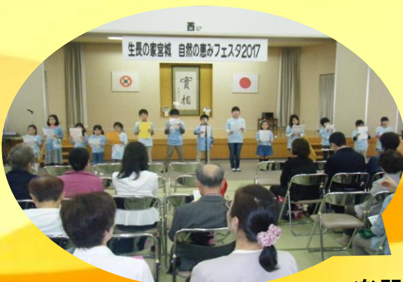
楽器演奏や合唱の発表 ♪